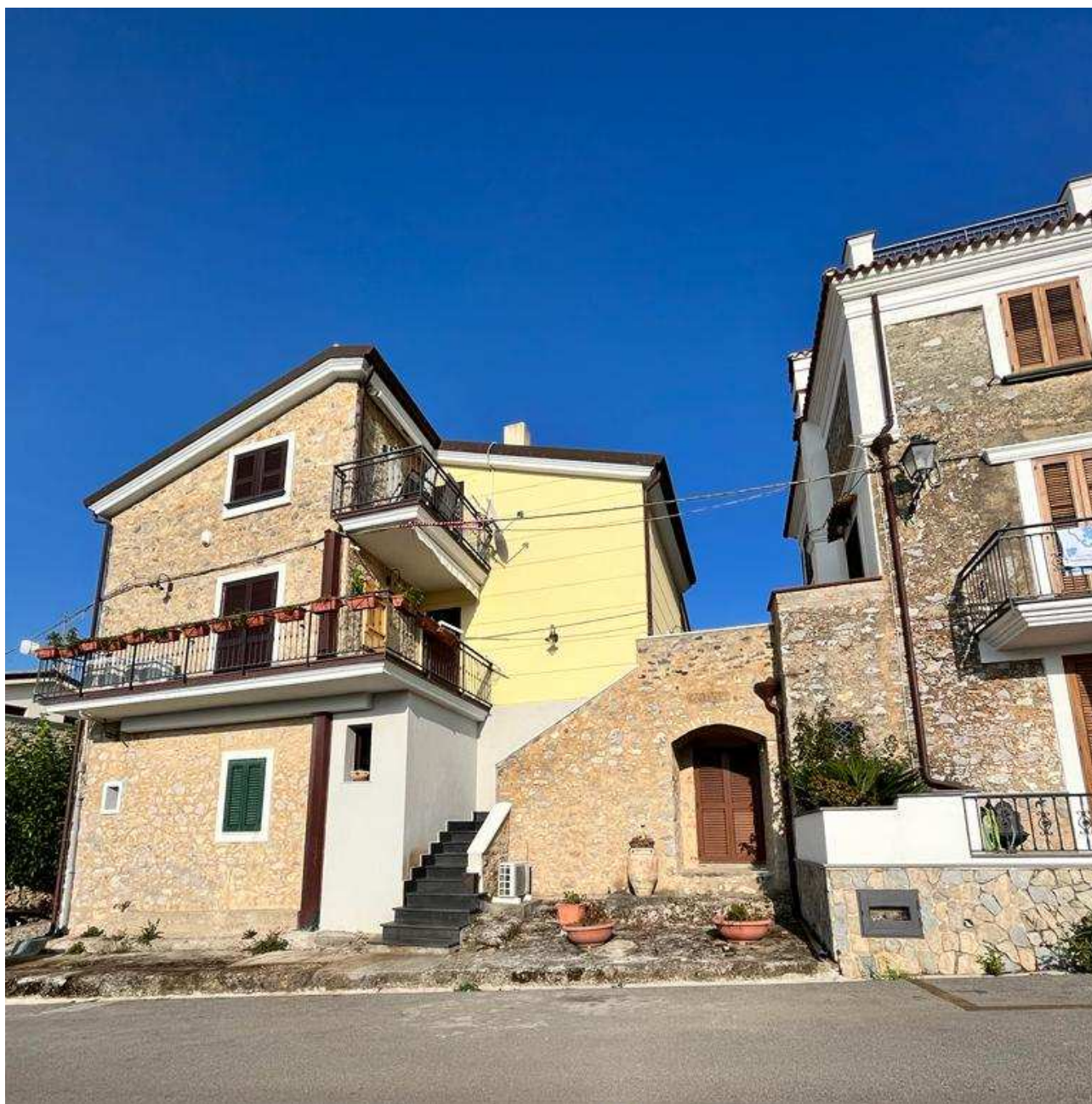
Foto 2: Fabbricato in esame vista dalla via Belvedere (lato OVEST)