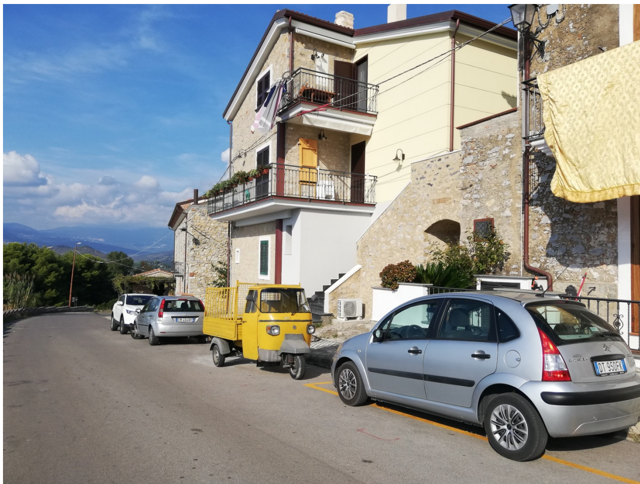
Foto 3 fabbricato in esame vista dalla via Belvedere (lato SUD-OVEST).