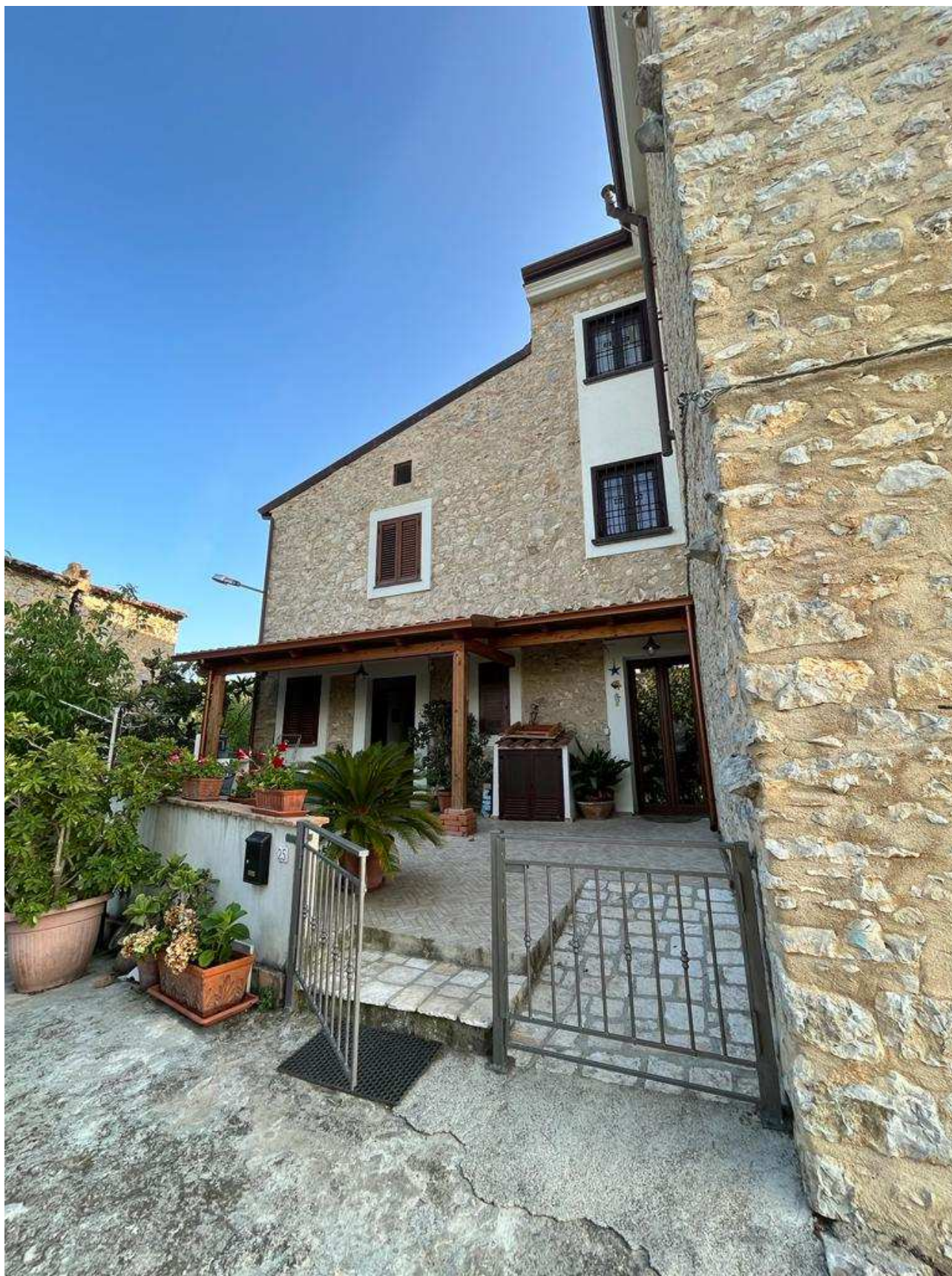
Foto 1 Area pertinenziale oggetto di Accertamento (Vista lato Nord)